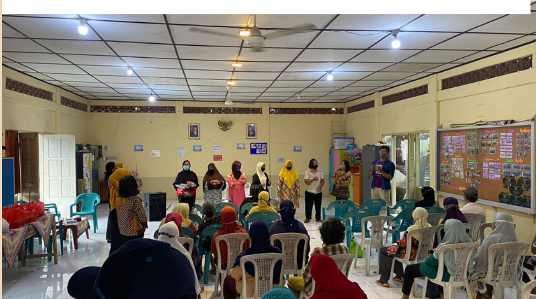
DOKUMENTASI POSYANDU LANSIA