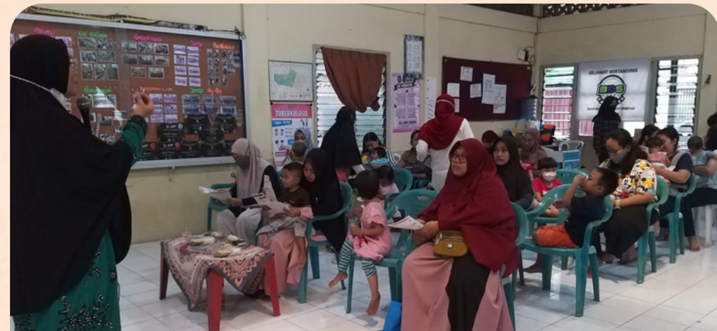
DOKUMENTASI KEGIATAN SOSIALISASI

Salah satu edukasi yang dilaksanakan pada bulan november yaitu, sosialisasi mengenai keamanan penggunaan kosmetik kepada ibu hamil dan menyusui. Sosialisasi tersebut dilaksanakan oleh Mahasiswa Fakultas Farmasi UGM pada tanggal 15 November 2022 di Balai Padukuhan Blimbingsari.