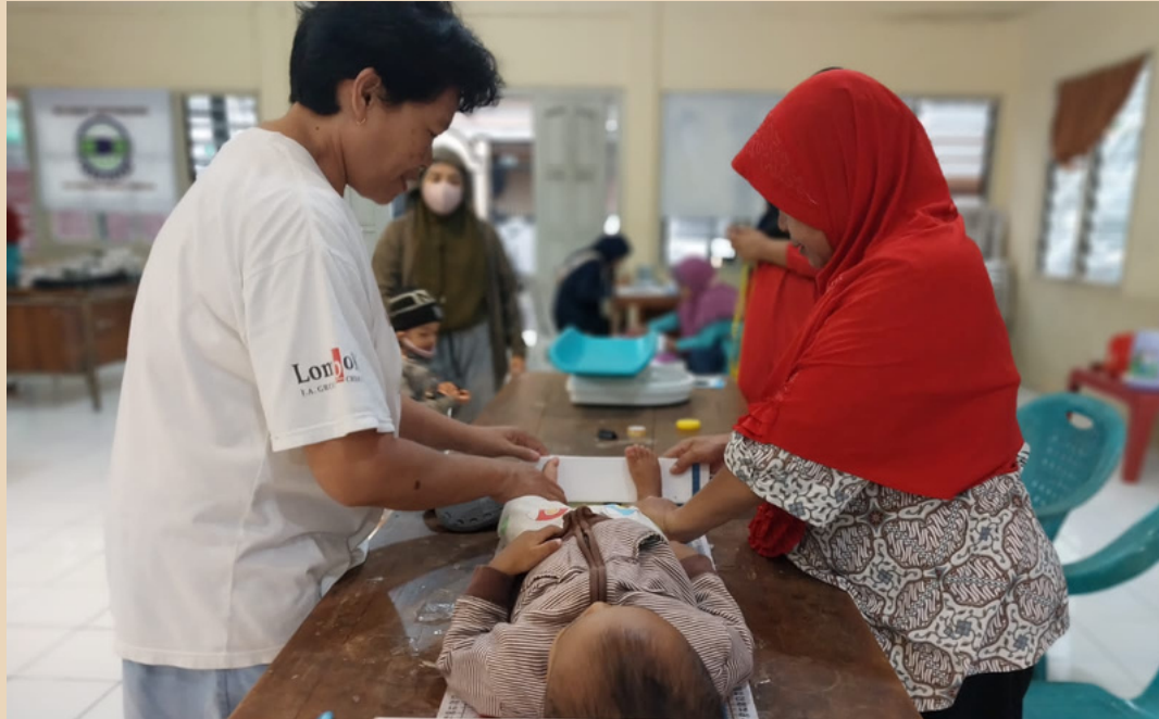
DOKUMENTASI POSYANDU BAYI dan BALITA