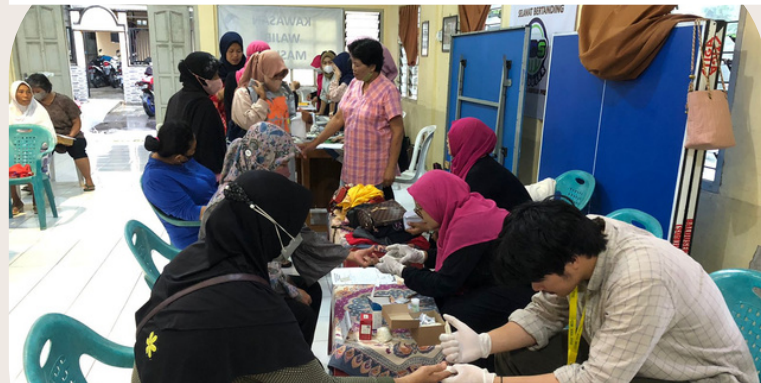
Dokumentasi Praktik Pelatihan

POSBINDU merupakan salah satu kegiatan rutin yang dilaksanakan di Blimbingsari. Kegiatan ini dilaksanakan pada tanggal 16 setiap bulannya di Balai Padukuhan blimbingsari. Sasaran dari kegiatan ini yakni warga blimbingsari yang termasuk kedalam usia produktif. Kegiatan ini diselenggarakan oleh kader kader posbindu Blimbingsari.